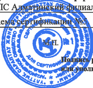
Схема сертификации №5

Подпись руководителя органа по подтверждению соответствия или уполномоченного им лица